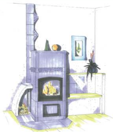
Gezeigte Skizze als Beispiel, wie man einen Tulikivi-Ofen gestalten kann.